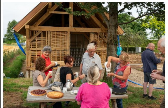
Vrijwilligers bouwen samen aan het huis dat straks de basis van de Dorpsgaard vormt.

Paul Dolhain Zaterdag 3 augustus 2024 om 14:13