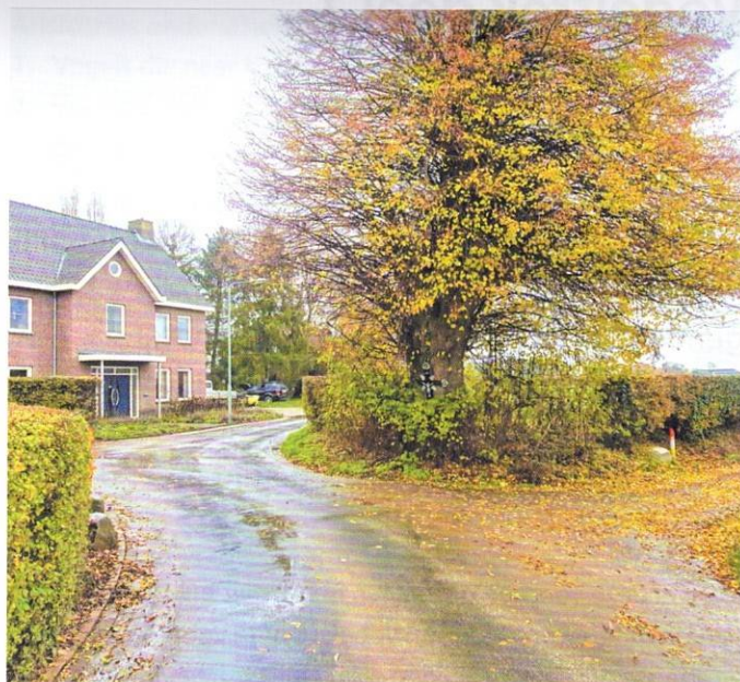
Lindekruis in Webrig/Genhout.

en Nuth passeren we weer een Lindekruis op het kruispunt van de Valkenburgweg en de Maastrichterweg. Die laatste handelsweg liep van Maastricht naar de huidige spoorbrug van Nuth en sloot daar aan op de vermoedelijke Romeinse heerbaan naar de stadjes Gangelt, Heinsberg en Neuss. De kruislinde van de Bies staat niet toevallig ook op de oude gemeentegrens. De heilige in de boom leek op Christoffel, de beschermheilige van de reizigers. In Genhout volgen we de Grootgenhouterstraat naar Webrig. De Sittarderweg werd voortgezet via de Bosscherstraat langs Spaans Neerbeek en de Geleense kluis naar Sittard. Spaans Neerbeek herinnert aan de staatkundige situatie tijdens de 17 de eeuw waarin Neerbeek gescheiden was door een Beeks ('Hollands') gebied en een Spaans deel dat tot Geleen behoorde. Ik heb daar ook bewoners gekend met een Spaans uiterlijk, maar dat kan toeval zijn. Een halve eeuw geleden maakte Spaans Neerbeek overigens plaats voor een Geleense nieuwbouwwijk.