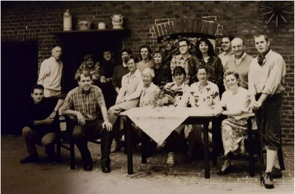
Vreigel op d'n hoof, 1995