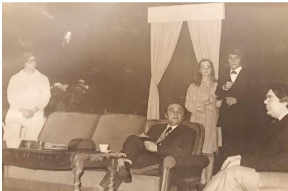
De blauwe diamant 1973