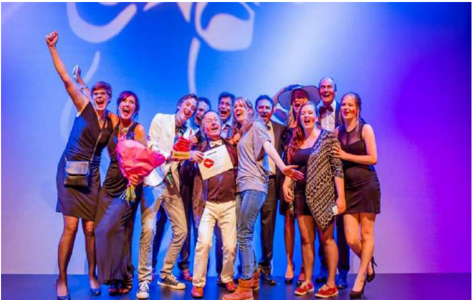
Muulke voor de meest bijzondere voorstelling, Het Atelier, 2013