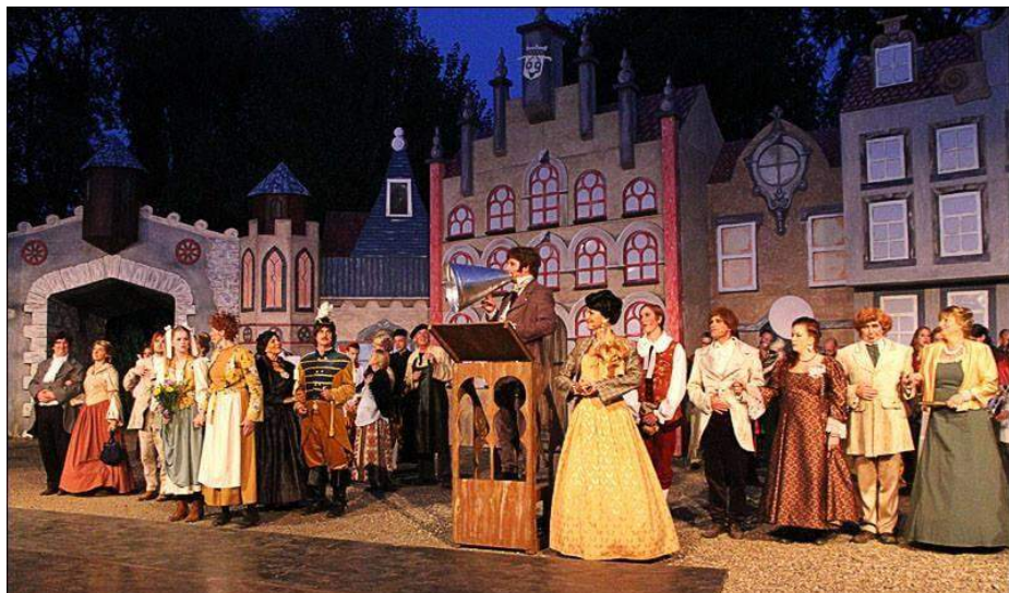
De Inspecteur, 2014